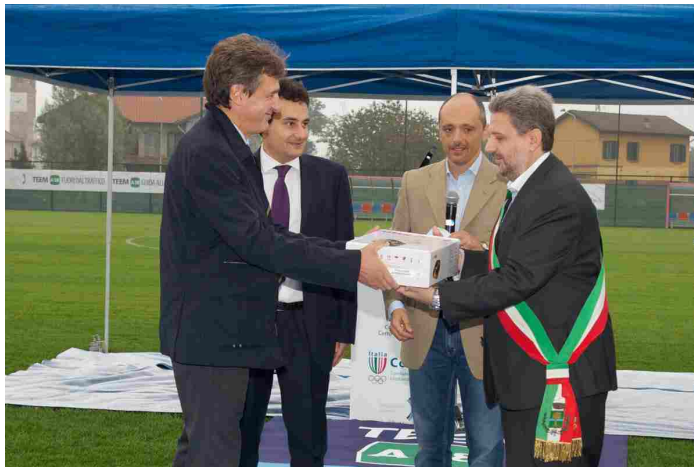
L'AD di Te consegna defibrillatore

Tale affluenza, che avrebbe potuto risultare anche più cospicua in condizioni meteorologiche più favorevoli, accredita la sensazione che TEEM-A58 abbia centrato l'obiettivo dichiarato di riparare al danno arrecato alla comunità locale sull'onda dell'impossibilità materiale di «dribblare» il vecchio campo con l'asse autostradale in costruzione.