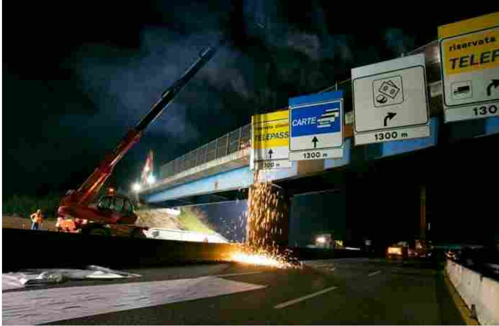
La notte bianca delle infrastrutture

L'imponente dispiegamento di uomini e mezzi garantito dal Consorzio Costruttori nei cantieri illuminati a giorno dalla luce delle fotoelettriche ha, del resto, consentito alla Concessionaria Tangenziale Esterna Spa di centrare, grazie al completamento delle operazioni in tempi record, l'obiettivo rappresentato dal superamento di quota 60% delle costruzioni nel Lotto Sud, interessato dal raccordo con l'Autostrada del Sole, e di «cima» 70% delle opere nel Lotto Nord, toccato dalla connessione con la Torino-Trieste.