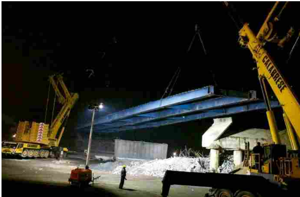
La notte bianca delle infrastrutture

accesso alla viabilità ordinaria della Grande Milano, TE aveva, d'altra parte, già dimostrato di essere in grado di ultimare l'intera tratta autostradale entro la primavera del 2015 . Stiamo parlando, ovviamente, dei 32 chilometri da Agrate Brianza a Melegnano interconnessi, appunto, a nord con l'A4, al centro con la nuova «direttissima» Brescia-Milano e a sud con l'A1.