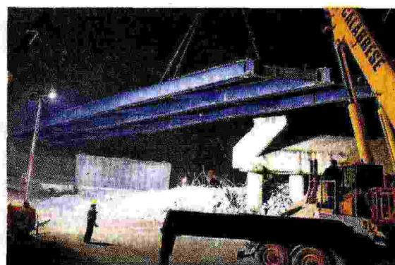
Alcune fasi delle operazioni di collegamento tra Teem e A1 portate avanti tra sabato e domenica scorsi.