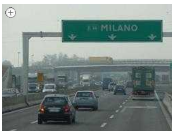
L'autostrada A4 verso Milano

Agrate Brianza-Caponago - Tangenziale Est Esterna di Milano e Brescia-Bergamo-Milano. Dalle 4,30 di mercoledì Tem (tangenziale est esterna di Milano) e Brebemi (la Brescia-Bergamo-Milano) sono strutturalmente unite (guarda qui il video delle fasi finali di collegamento). E' stato portato a termine con successo in sole quattro ore il varo della rampa che scavalca la linea ferroviaria Milano-Venezia in prossimità dei Comuni di Melzo e Pozzuolo Martesana e completato, di fatto, lo svincolo fra la nuova arteria autostradale (32 chilometri di tracciato da Agrate Brianza a Melegnano) e Brebemi.