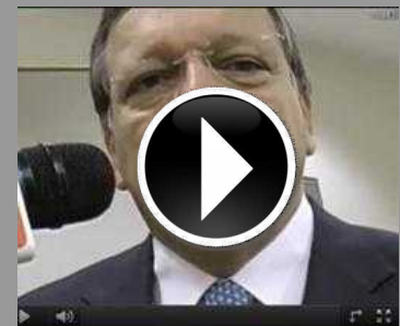
Barroso: "L'Italia consolidi la sua stabilità politica"...