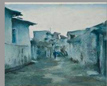
Mostre/ Le opere di Adrian Paci: mix tra immaginario