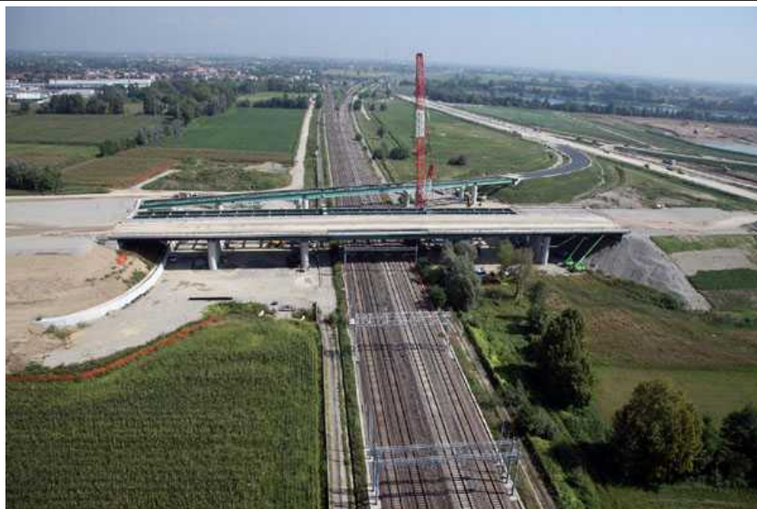
Sovrappasso TEEM ferrovia Mi Bg Melzo Pozzuolo

“Stiamo effettuando tutti gli interventi con modalità che non recano alcun disagio né ai pendolari né alla popolazione residente – ha sostenuto l'amministratore delegato di Tangenziale Esterna Spa Stefano Maullu -. Ritengo che il motto di TE “Crescita, lavoro e... ingegno-In Italia le opere che creano ricchezza non stanno solo nei musei” riassume alla perfezione lo scopo che la Concessionaria persegue con impegno, orgoglio e professionalità”.