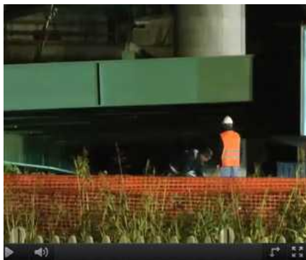
Varo viadotto TEEM-BREBEMI

Ma il Lotto Centro, che, appunto, comprende la bretella disegnata per impedire a BreBeMi di sfociare in un campo grano, non è l'unico di TEEM a rispettare il cronoprogramma stilato, dopo l'approvazione del progetto esecutivo in sede di Comitato Interministeriale per la Programmazione Economica, da TE in sinergia con Concessionaria Autostradali Lombarde. Com'è stato possibile accertare anche dall'équipe de projet di Banca Europea per gli Investimenti durante il sopralluogo in elicottero ai cantieri effettuato il 13 settembre scorso, pure il Lotto Nord (allacciamento con l'A4) e il Lotto Sud (collegamento con l'A1) stanno rispettando la tabella di marcia incentrata sull'inaugurazione in concomitanza con la vernice di Expo (giugno 2015). Dall'alto è più facile, del resto, coglierne plasticamente lo svincolo per svincolo la dimensione turbo impressa da TE e da CCT alla realizzazione dell'opera con l'ultimazione degli scavi per la connessione con l'A1 nel Lotto Nord e l'attuazione nel Lotto Sud di interventi complessi come la costruzione della galleria tra Dresano e Casalmajocco. Il Lotto Sud, incardinato sul trafficatissimo nodo viario di Melegnano, entro ottobre dovrebbe, peraltro, essere interessato anche dall'avvio dei lavori per la realizzazione della bretella tra le Provinciali Binaschina e Cerca, attesa da almeno quarant'anni sia dai pendolari sia dai residenti nel congestionato quadrante Sud del Milanese.