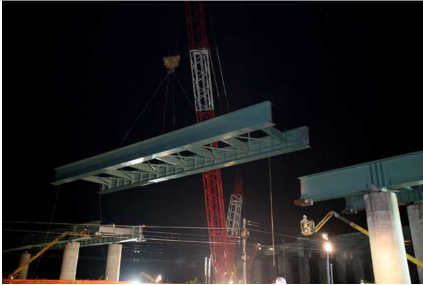
Varo viadotto Teem Brebemi

Ma il Lotto Centro, che, appunto, comprende la bretella disegnata per impedire a BreBeMi di sfociare in un campo grano, non è l'unico di TEEM a rispettare il cronoprogramma stilato, dopo l'approvazione del progetto esecutivo in sede di Comitato Interministeriale per la Programmazione Economica, da TE in sinergia con Concessionaria Autostradali Lombarde. Com'è stato possibile accertare anche dall'équipe de projet di Banca Europea per gli Investimenti durante il sopralluogo in elicottero ai cantieri effettuato il 13 settembre scorso, pure il Lotto Nord (allacciamento con l'A4) e il Lotto Sud (collegamento con l'A1) stanno rispettando la tabella di marcia incentrata sull'inaugurazione in concomitanza con la vernice di Expo (giugno 2015). Dall'alto è più facile, del resto, coglierne plasticamente lo svincolo per svincolo la dimensione turbo impressa da TE e da CCT alla realizzazione dell'opera con l'ultimazione degli scavi per la connessione con l'A1 nel Lotto Nord e l'attuazione nel Lotto Sud di interventi complessi come la costruzione della galleria tra Dresano e Casalmajocco. Il Lotto Sud, incardinato sul trafficatissimo nodo viario di Melegnano, entro ottobre dovrebbe, peraltro, essere interessato anche dall'avvio dei lavori per la realizzazione della bretella tra le Provinciali Binaschina e Cerca, attesa da almeno quarant'anni sia dai pendolari sia dai residenti nel congestionato quadrante Sud del Milanese.