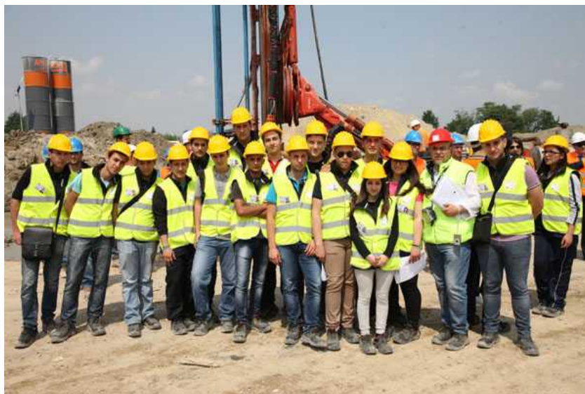
Studenti Reggio Calabria su cantieri Lambro Lotto C

L'inserimento di TEEM nell'elenco delle opere Trans European Network-Transport (TEN-T), quindi di rilevanza strategica comunitaria, ha aperto, inoltre, le porte a opportunità di finanziamenti da parte di Banca Europea per gli Investimenti. Un'altra eccellenza tutta italiana, ovvero Cassa Depositi e Prestiti, ha già accordato una corsia preferenziale all'infrastruttura e sta definendo i termini del suo intervento. L'intero investimento privato verrà, comunque, ripagato dai proventi generati dalla riscossione dei pedaggi di transito sulla nuova infrastruttura. La concessione affidata da CAL a TE prevede, del resto, anche la gestione della nuova opera per 50 anni dall'entrata in esercizio. Si tratta della più duratura concessione mai approvata in Italia.