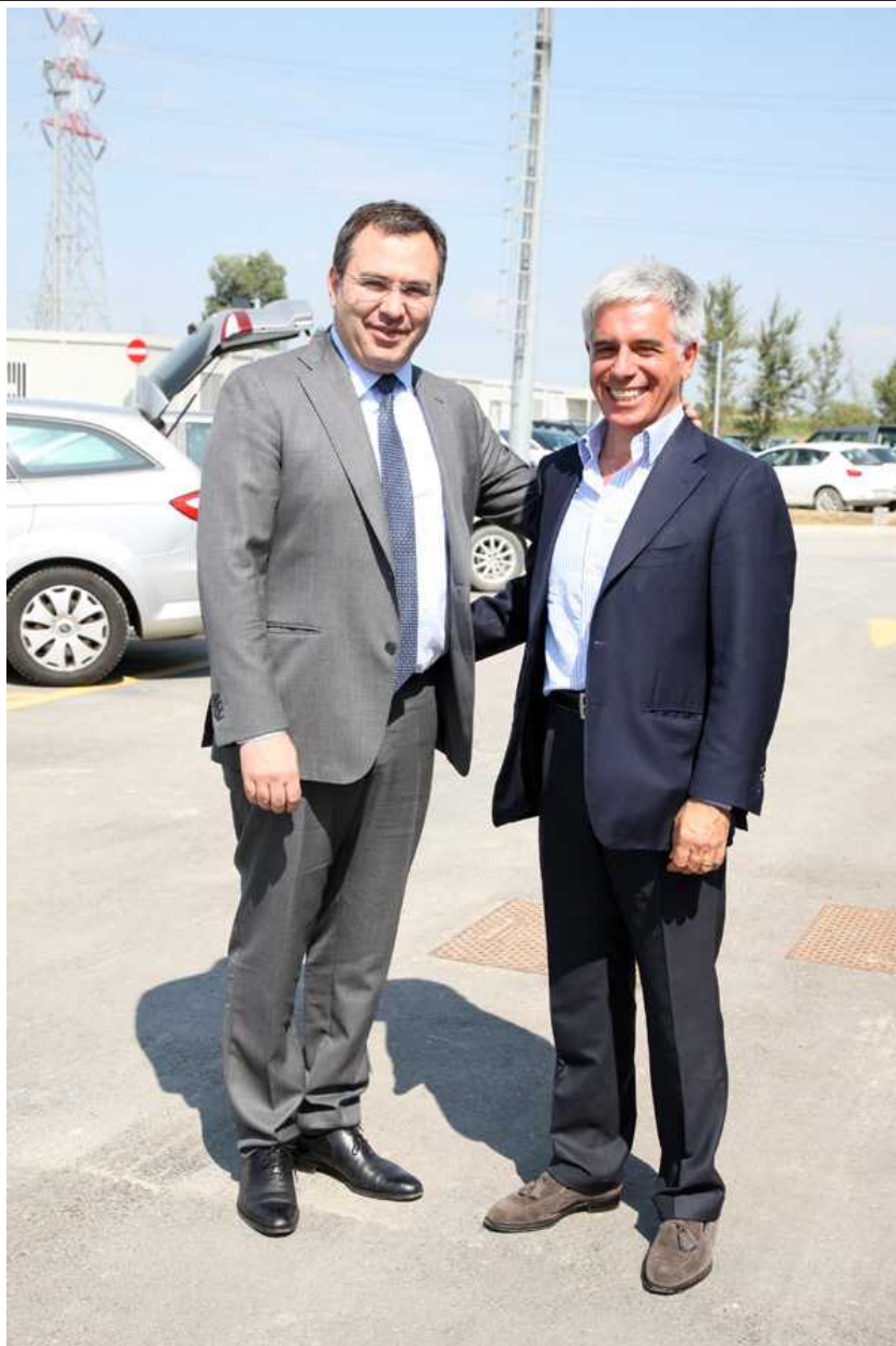
L'AD Maullu con assessore del Tenno

L'infrastruttura-sistema risulta integrata da tantissimi altri collegamenti auspicati da quattro milioni di cittadini non meno di una nuova Tangenziale, caratterizzata da fondamentali progetti ambientali e condivisa, attraverso l'Accordo di programma definito dalla Regione Lombardia, dalla Provincia di Milano, che ne ha promosso la realizzazione, da quelle di Lodi e di Monza-Brianza nonché da tutt'e 34 i Comuni direttamente lambiti dal tracciato autostradale.