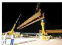
Il "varo" del ponte Teem sull'autostrada A1