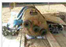
È il giorno di «Old Lady», la maxi-bomba che tiene Vicenza col fiato sospeso