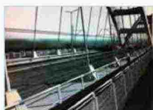
Il progetto del ponte Zezellj a Novi Sad