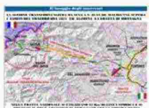
La linea Torino - Lione e i cantieri