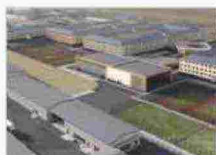
La maxi-commessa di Bonatti in Kazakhstan