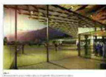
La nuova stazione Susa. Progetto firmato dall'archistar giapponese Kengo Kuma