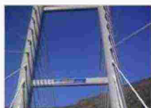
Il viadotto Favazzina, sulla Salerno-Reggio Calabria