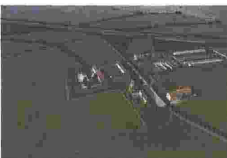
MUZZA - SAN BIAGIO DI ROSSATE