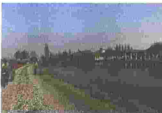
MUZZA - VILLAMBRERA