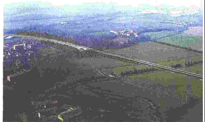
LAMBRO - ROCCA BRIVIO