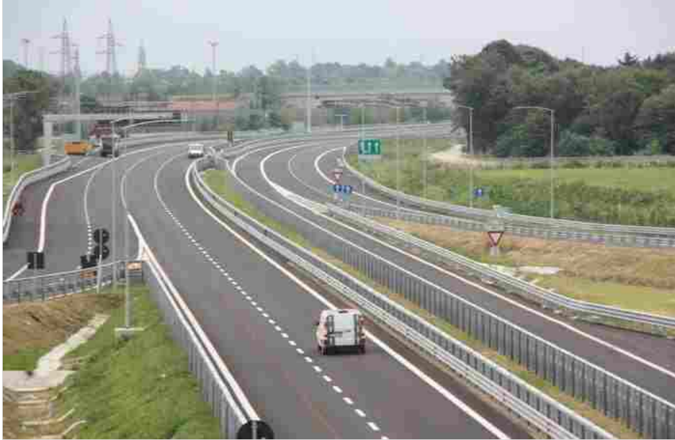
La Brebemi in prossimità dell'interconnessione con Teem