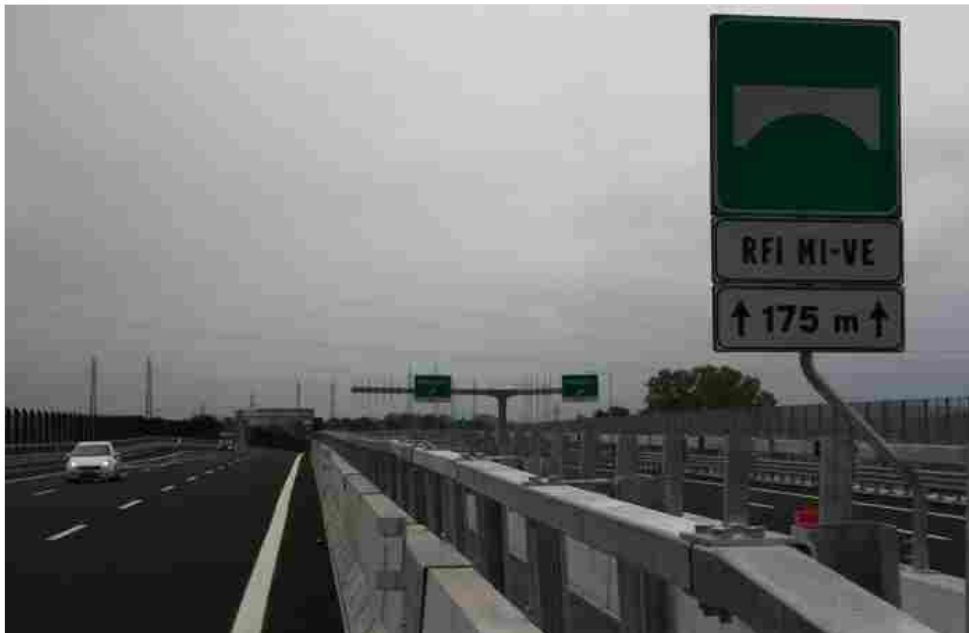
Un tratto di Arco Teem