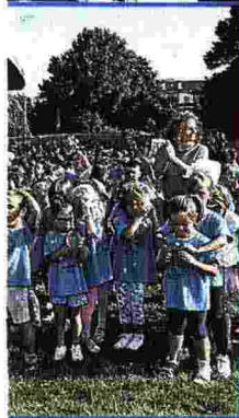
APPLAUSI Momenti di festa a melzo con il ministro Marco Bussetti e la preside Stefania Strignano Sotto il momento clou della mattinata di Cerro al Lambro