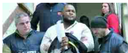
I tentacoli della mafia nigeriana sull'Italia