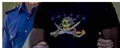
Mafia nigeriana, l'esperta: "Ecco come trasferiscono il denaro senza lasciare traccia"