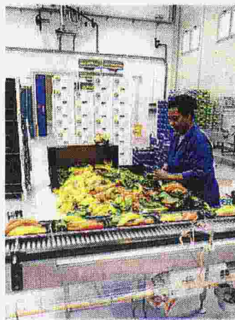
Un'operatrice al lavoro alla CeDiOr

NUOVA ATTIVITÀ CeDiOr, punto di riferimento per l'Ortomercato, è operativa nel capannone vicino alla Tem