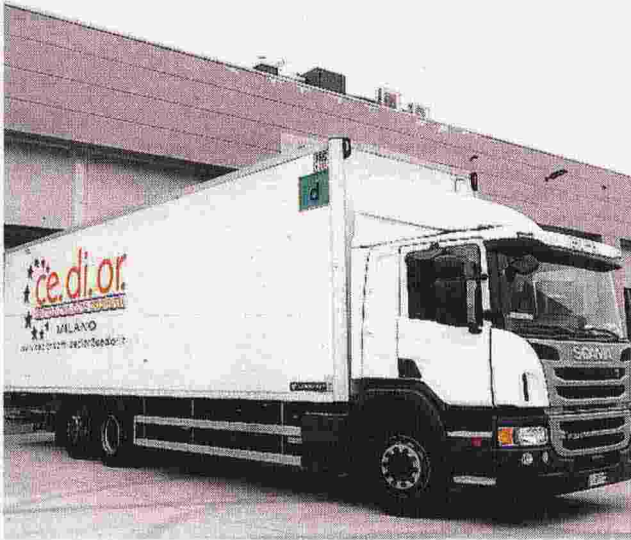
Sopra uno dei mezzi "targati" CeDiOr, a fianco una delle lavoratrici